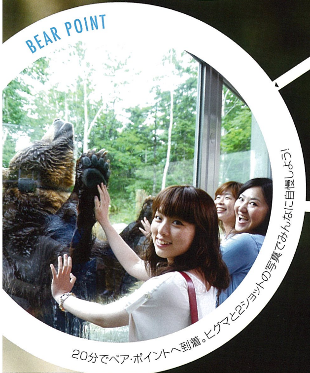
20分でベア・ポイントへ到着。ヒグマと2ショットの写真でみんなに自慢しよう!