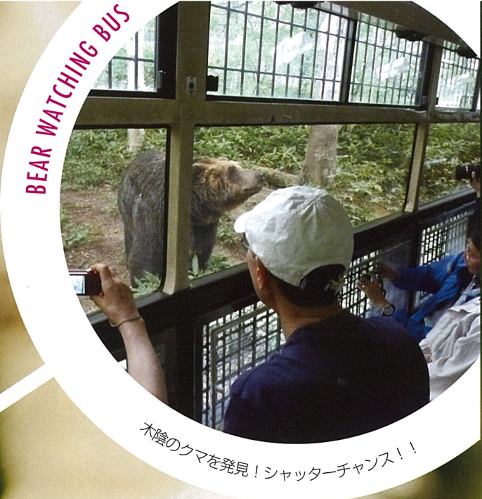
木陰のクマを発見! シャッターチャンス!!