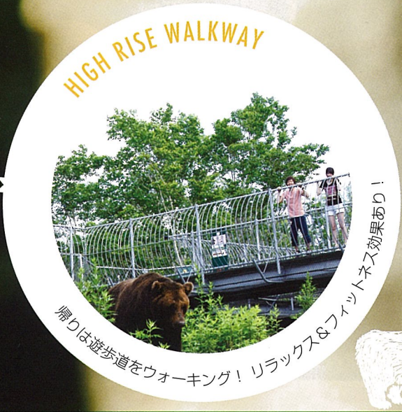
帰りは遊歩道をウォーキング! リラックス&フィットネス効果あり!