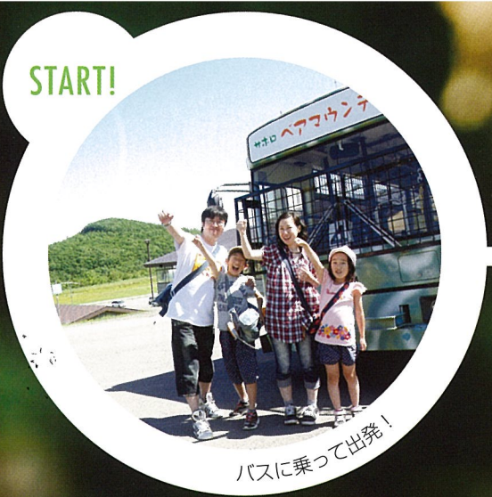
バスに乗って出発!